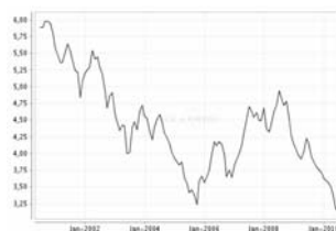
Übersicht: 10 Jahre