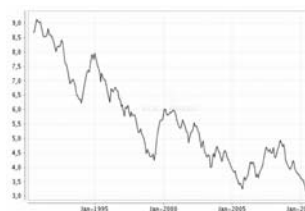
Übersicht: 20 Jahre