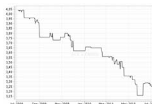
Übersicht: 1 Jahr