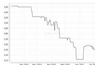
Übersicht: 6 Monate