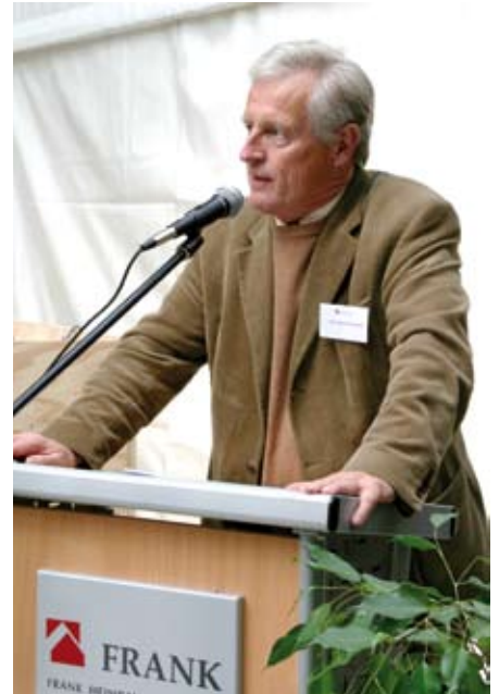
Verständnis und Transparenz werden durch Mitarbeiterinformationsveranstaltungen gefördert.

Denn je umfassender jeder einzelne Mitarbeiter informiert ist bzw. sich informieren kann, umso besser kann er die seinen Arbeitsbereich betreffenden Änderungen auch nachvollziehen und umsetzen.