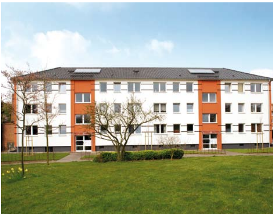
Saniertes Mehrfamilienhaus in Kiel-Holtenau