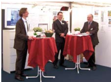
Messestand beim Tag des Eigenheims in Hamburg

Neben der kaufmännischen Beratung im Rahmen der Durchsetzung etwaiger Mieterhöhungen gehören ebenso die Bauleitung während der Sanierungsphase wie das Qualitätsmanagement nach Abschluss der Ar